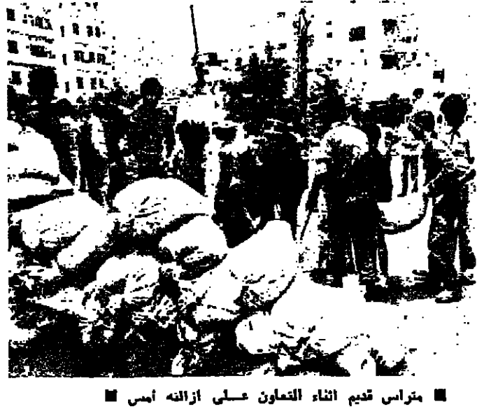
ممراس قديم اثناء التعاون على ازالته امس

رفضوا واصروا على ازالها الى الطريق وكان رفع كل « ممراس » يتطلب حوالي نصف ساعة من النقاش .. وحدات الجرارات بالمتارينس الصنعية تهيئ الوصول الى الكفرة - وحملت السحاكات على تنظيف الشوارع من الرمل ..